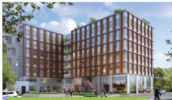
Perspective Unplug - ZAC Cambacérés - Montpellier (34)

Le 31 mars 2021, Accimmo Pierre a acquis définitivement en VEFA l'immeuble Unplug dont la promesse avait été signée en novembre 2020. Situé dans la ZAC Cambacérés, à Montpellier, l'immeuble développe environ 8 200 m 2 pour un volume d'acquisition de 26,8 M€.